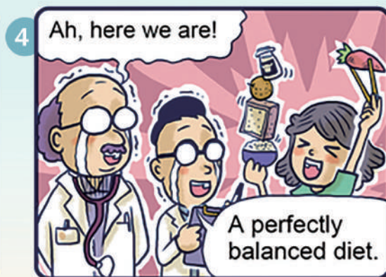
▲啊，有啦！這位均衡飲食，什麼都吃！